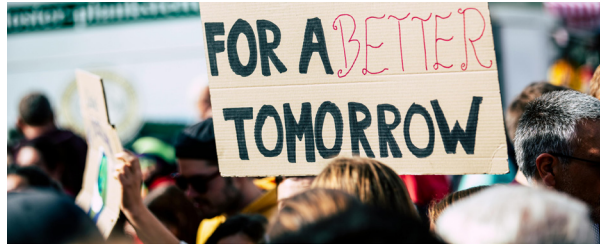
For a better tomorrow. pexels-markusspiske

Mit der neuen Initiative #politisch.sein setzt das Forum Katholischer Erwachsenenbildung ein deutliches Zeichen für die Bedeutung politischer Bildung als kirchlichen Auftrag.