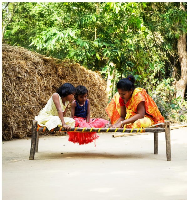
Frau gibt ihr Wissen an Kinder weiter.

Ein zentrales Element ist die Ausbildung sogenannter „Barefoot Counsellors“ – Frauen aus indigenen Dörfern, die in Gewaltprävention, Rechtsaufklärung und Konfliktlösung geschult werden, agieren innerhalb ihrer Dörfer und tragen zur Schaffung sicherer Räume bei.