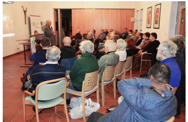
Die zweite Jennersdorfer Friedenstagung.

Willi Brunner · 0676 880 701 501 willibald.brunner@martinus.at