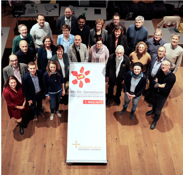
Teilnehmer:innen des PGR-Studientages 2025. PGRÖ

Rückblick, Austausch, Perspektiven und inspirierende Glaubenserfahrungen